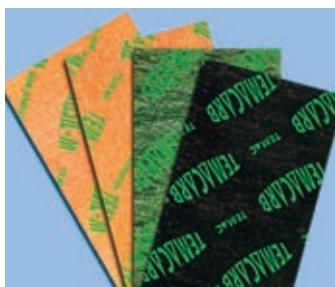
Těsnění z bezasbestových desek