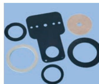
Těsnění z technické pryže