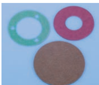
Těsnění z papíru a lepenky