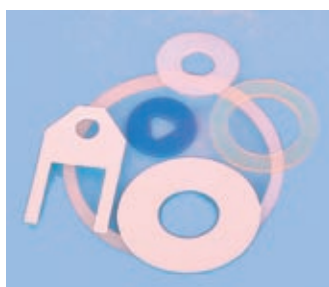
Těsnění z plastických hmot